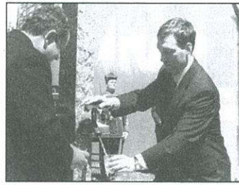
A kormányfő ivott először a kútból

Berzsényi Dániel születésnapja tiszteletére ivókutát avattak e napon a Berzsényi Múzeumnál. A köztéri plasztikát Blaskó János szobrászművész alkotta, vésett Berzsényi-idézettel, szólóleveles vízköpővel. Az ünnepség végén a megemlékezés koszorúit helyezte el több intézmény, állami és civil szervezet a költő szülőházának falán.