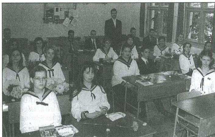
Ballagás előtt a gimnázium végzősei

– A mai estén a hang, a szó és a szín találkozásának szemtanúi lehetünk – fogalmazott az író. Mindez jól érzékelteti a három művészeti ág összetartozását. A közös az bennük – Tüskés Tibor szerint –, hogy mindegyik szerkezetileg megközelíthető. (Folytatás a 2. oldalon)