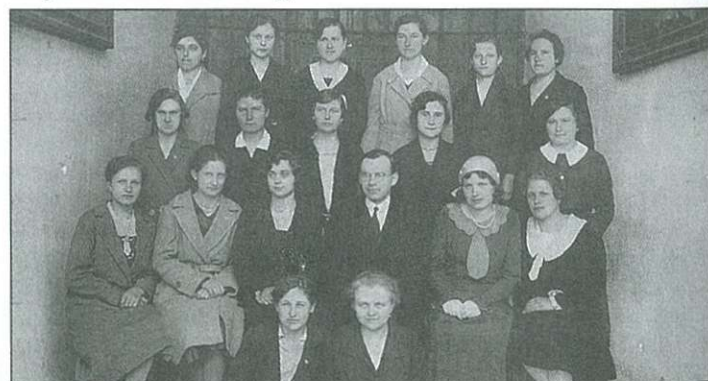
Az egykori Leányegylet tagjai