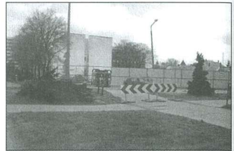
A Korona-sarkon hamarosan építkeznek

A Géfin téren nemcsak az ABC, hanem a művelődési központ és maga a tér is megérett a felújításra. Mindenképpen meg kell valósítani a közművek javítását. A távhő rekonstrukciója még az idén lehetővé teszi, hogy kicseréljék a vezetékeket, s a vízvezetékekre is sor kerülhet jövőre. Utána jöhet szóba a burkolat felújítása, majd az épület tervezése. Saját forrásból ezt sem lehet megoldani, így várni kellene valamilyen kedvező pályázati lehetőségre.