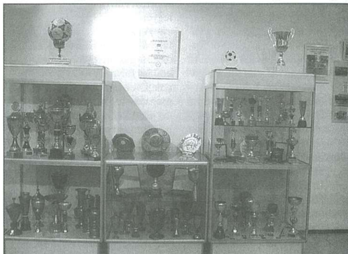
Sporttrófeák a CVSE jubileumi kiállításán

nak széles választási lehetőséget kínálnak. A sportegyesületek, diáksportkörök az ifjúságnak a versenysport területén nyolc sportágban biztosítanak részvételt. A szabadidősportban különösen az iskolák járnak az élen, de évről évre szaporodik a fel-