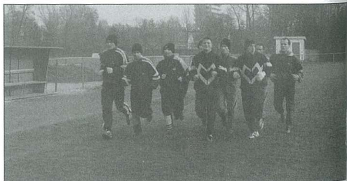
Felvételünk még az edzőtáborozás előtt, a labdarúgók celldömölki gyakorlósán készült.