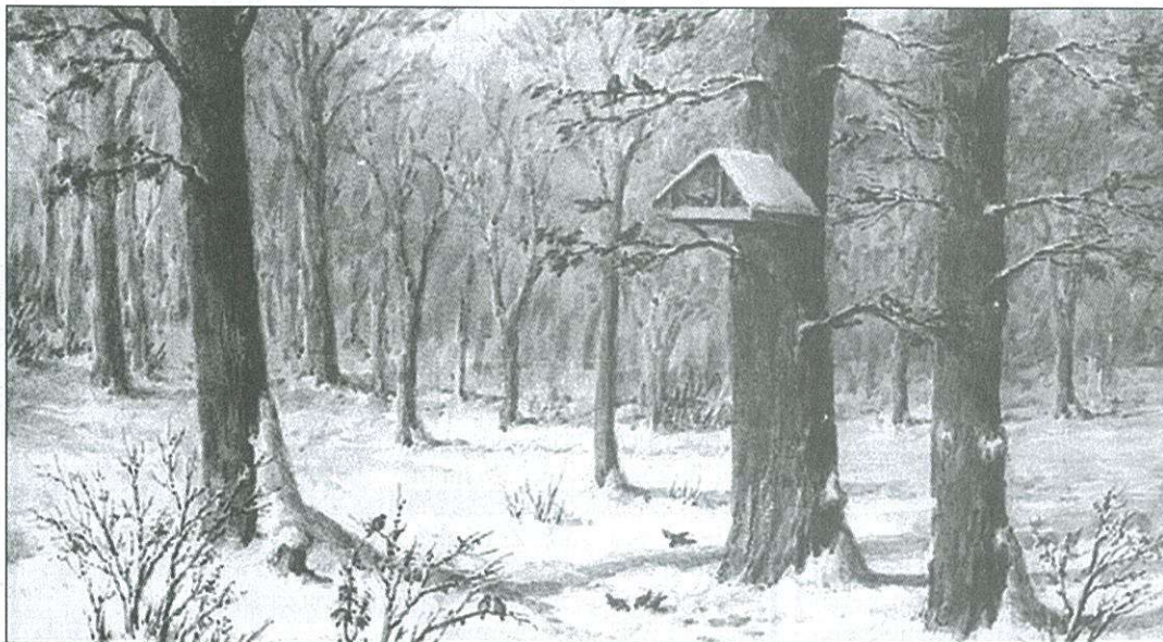
Etessük télen is a madarakat! – erre is figyelmeztet ez a korábban készült felvétel

lepeken pedig megnövekedtek fák, ide költöztek.