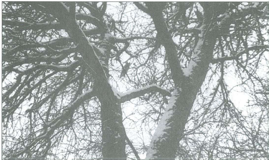
„Bagolyfa” a Ság hegyen – régebbi felvétel

A madárfigyelő ember ismeri számos faj szokását, mindenekelőtt a jobban megfigyelhetőket, a nálunk telelőket. Ennek sorába tartozik a bagoly, köztük az erdei fülesbagoly. Pár évtizeddel ezelőtt még a Ság hegyen volt kedvelt telelőhelyük, nagy, főleg ágas-bogas öreg körtefákon tanyáztak. Azóta azt tapasztaljuk, hogy városalakók lettek, „civilizálódtak”, a régi hegyi helyükre nem térnek vissza. Elvéve akadhat még ott telelő. A váltásnak számos oka van, leginkább az, hogy a régi fákat – kiöregedvén – a gazdák kivágták. Az életterük beszűkült. A városi lakóte-