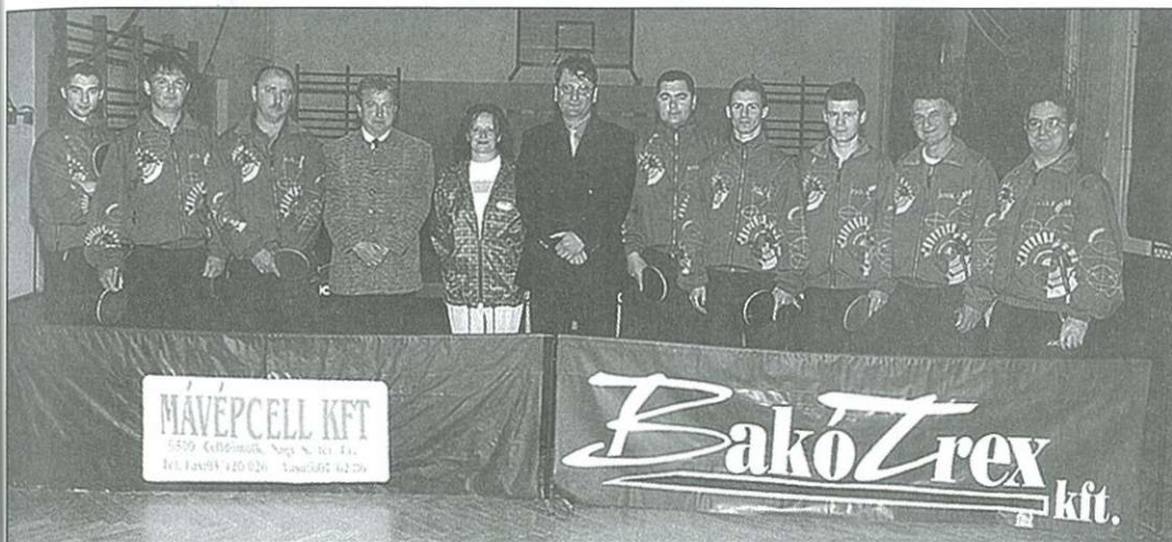
Az NB II-es bajnokság tagjai, vezetői és szponzorai