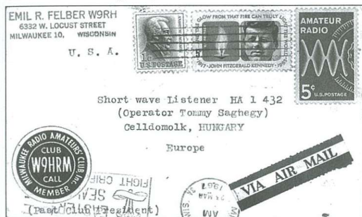
A lapok a nemzeti rádióamatőr szervezetek irodáin keresztül jönnek. Ritka a postán küldött lap – ezek közül való egy, amely az USA-ból érkezett

A rádióamatőrök célja tehát egy „országhatárok nélküli világ” megteremtése, a népek és emberek közti barátság kiépítése és ápolása. Nem véletlen, hogy az 1950-es, '60-as, '70-es években az MHSZ és jogelődeinél működő klubokban a rádió adó-vevő berendezéseket jobban kellett zárni, mint a céllovész fegyvereit. Jogos! „A rádióval messzebbre lehet lőni!”