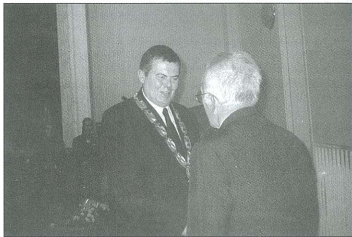
Rektori kézfogás Sopronban, 2000-ben

– Előbb mérnöki, majd építésvezetői, főépítésvezetői, műszaki főcsoportvezetői (főmérnök helyettesi), végül főmérnöki beosztásban dolgoztam. A 35 évnyi aktív munkából az utolsó 15 évet főmérnökként szolgáltam. Nyugdíjasként 5 évet dolgoztam a Beton-útépítő Vállalatnál.