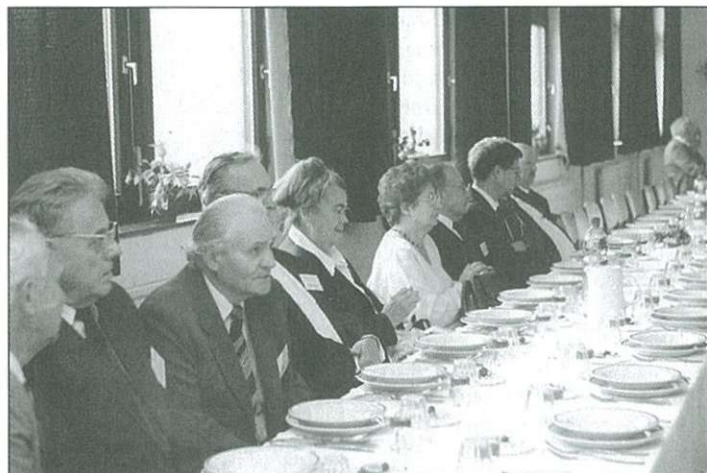
Az ebédhez készülődnek a vendégek

Az orgonahangverseny során Girolamo Diruta (1550-?), Jan Pieterse Sweelinck (1562-1621), Jean-Francois Dandrieu (1682-1738), Johan Pachelbel (1653-1706), Johannes Brahms (1833-1897) és Johann Sebastian Bach (1685-1750) műveiből hangzottak el részletek; utóbbi halálának június 28-án volt a 250. évfordulója. Brahms és Bach művei elhangzásának sorrendje nem volt véletlen: előbbi nem volt orgonaszerző, de nagy tisztelője volt Bachnak, így a Brahms szerzemény mintegy bevezető volt a Bach-művekhez.