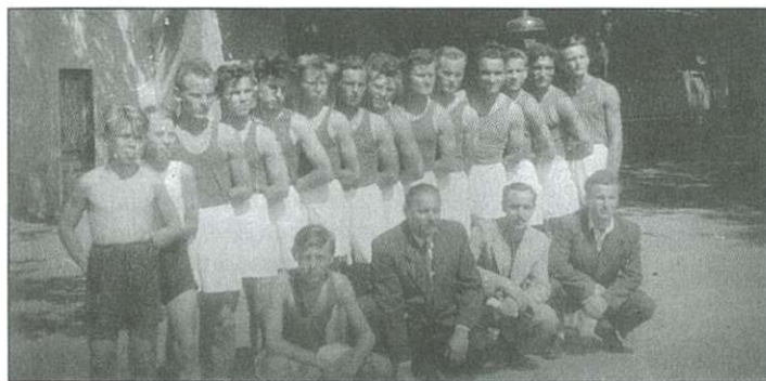
A CVESE ökölvívócsapata a Griff Szálloda udvarán