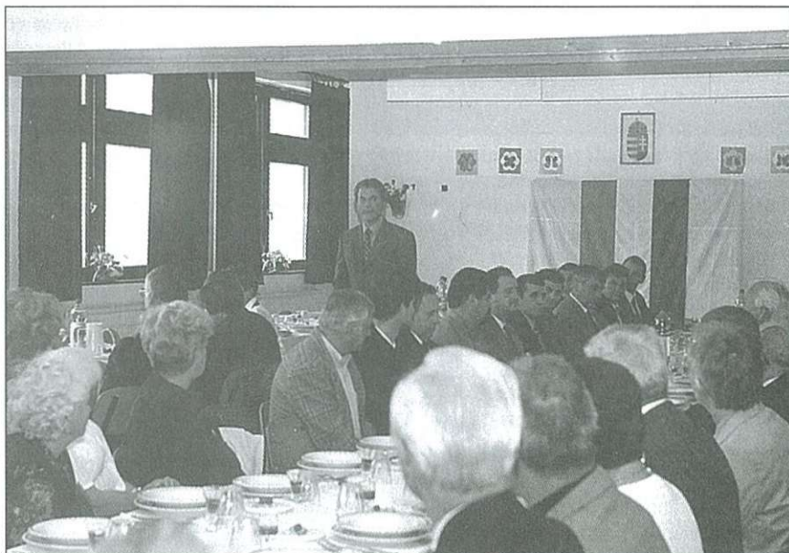
Ebéd előtti köszöntő az alsósági iskolában