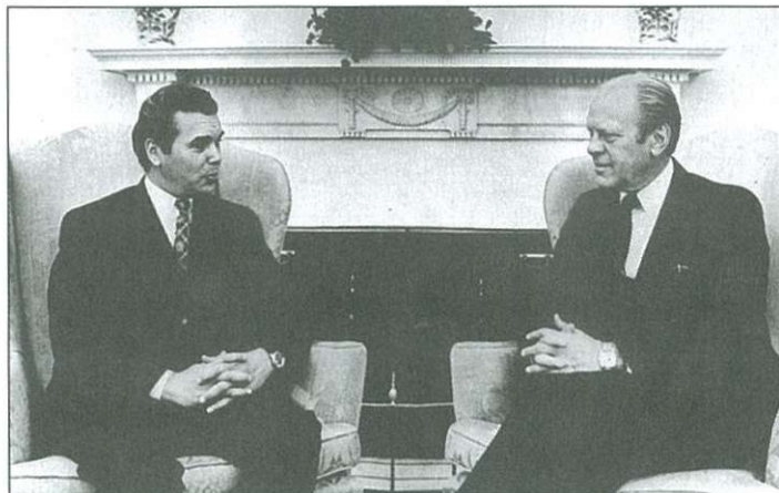
Találkozó a Fehér Házban Ford elnökkel 1976. május 4-én