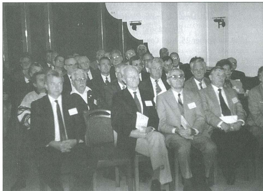
Találkozás és tájékoztató a polgármesteri hivatalban