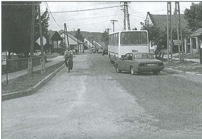
Bazaltzúzalék a Hegyi utca kezdeténél

– Amikor még KPM volt a rövidítése a ma már hosszú nevű közlekedési tárcánknak, ezeket nevezték „KPM-utaknak”?