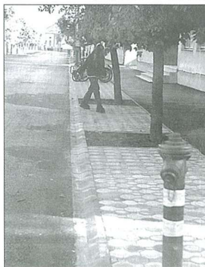
Dívburkolat a Gáyer iskola előtt

– Korántsem érkeztünk el a „por és bánat elmúlt” állapotához. Mindenesetre több helyen jelentős javulás következett be. Milyen ked-