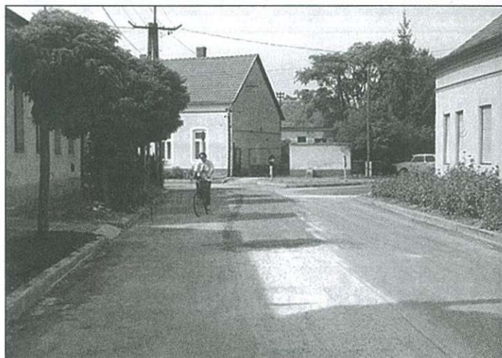
A Dózsa utca torkolata a Kossuth utca felől

Mindez az ott élő lakosságot károsítja, nem is említve, hogy a zökkenőkkel még hatalmas zaj is