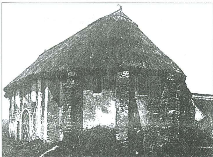
A romtemplom a század elején

Fontos a lakosság megszólítása, nyilvánvaló azonban, tömeges észrevételekre nem lehet számítani, ezért talán hasznosabb lenne bizonyos esetekben azok felé fordulni, akik egy adott területen kellő felkészültséggel bírnak. E tekintetben komoly háttérrel adhat két szerveződés is: a Kemenesaljai Baráti Kör és az idén második alkalommal összehívott elszármazottak találkozója. Sok kiváló tudós, e tájhoz vonzó szakember komoly szellemi tőke birtokosa. E szellemi tőkének a városunk javára történő kamatoztatásában jelentős tartalékok vannak. Éljük vele jobban. Legyen a város kezdeményezőbb irányukba.