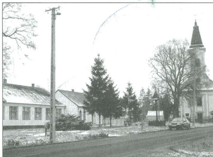
Kátyúzásra az idén 5,5 millió forint jut