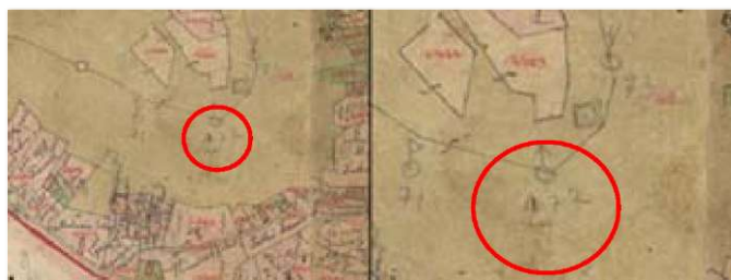
2. ábra A Ságiüreg jelkulcsi jelölése a Ság-hegy 1857-ben készített kataszteri szelvényén, a bejárat pirossal bekarikázva (forrás: Arcanum Adatbázis Kft.: Vas megye az első kataszteri felmérés térképein 1856 – 1860) Fig.2. The symbol of the Ságiüreg on the cadastral map from 1857 (source: (forrás: Arcanum Adatbázis Kft.: Vas megye az első kataszteri felmérés térképein 1856 – 1860)