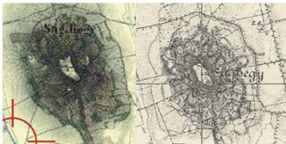
1. ábra A Ság-hegy a II. és III. katonai felmérés térképén Fig. 1. The Ság-mountain on the maps of the II. and III. military survey

Hadászati célokból és Magyarország területének jobb megismerése céljából a 18. és 19. században három katonai felmérést is végeztek. Az első 1780 és 1784 között, a második 1806 és 1869 között, a harmadikat pedig 1869 és 1887 között. Megvizsgálva a II. és III. katonai felmérések térképeit (1. ábra), amelyek abban a korban készültek, amikor a Ság-hegyi barlang első leírásait közreadták, megállapítható, hogy a barlang egyik térképen sem volt feltüntetve.