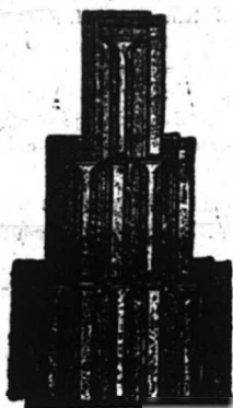
Nagykikindai gyártmány. Bohn-féle szab. biztonsági átfedőcserépek 272. szám.

Képes árjegyzék és minták kérésre ingyen és bérmentve.