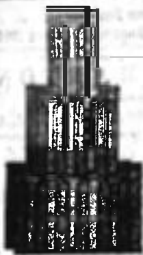
Nagykikindai gyártmány. Bohn-féle szab. biztonsági átfedőcserép 272. szám.

Képes árjegyzék és minták kérésre ingyen és bérmentve.