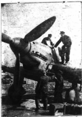
Német vadászok bevetésre kész gépet.