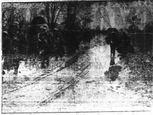
Keleten mindent előtört a hóé.

Mindaz azonban nem ad választ arra a kérdésre, ki kavarja-bát a háttéről ezt az izléselelen reklám hadjáratot? Mi sem magát Karádyt hibáztatjuk, hanem a körülötte és mögötte dolgozó üzleti kezeket és azt a közlést, amely nagy válságok korában ilyen öszelgésben áll ki magát.