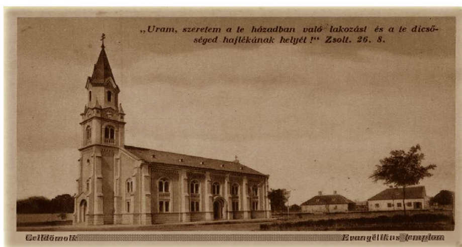
(VaML Képeslapgyűjtemény 3. sz.)

A belügyminisztériumnak szóló felterjesztés már ennek alapján készült. Indokaik: a két község összeépült, a vasútállomás nagyobb része Nemesdömölk határában van a kiscelli házaktól 15 méterre. (Fontos megjegyezni, a vasút valóban összeköt, tényleges összeépülésről viszont nem beszélhetünk.) Nemesdömölk szedte be a községi pótdadót, teljesítette a közmunkát, de a felügyeletet Kiscell végeztette. Egyesülés esetén a közigazgatás érdekeit könnyebben lehetett gyakorolni. Részletes vagyonkimutatást adtak, feltehetően még a látszatát is el akarták kerülni az ellentábor által többször hangoztatott vagyonszerzési kísérletnek, később látni fogjuk, van ennek jelzés értéke is.