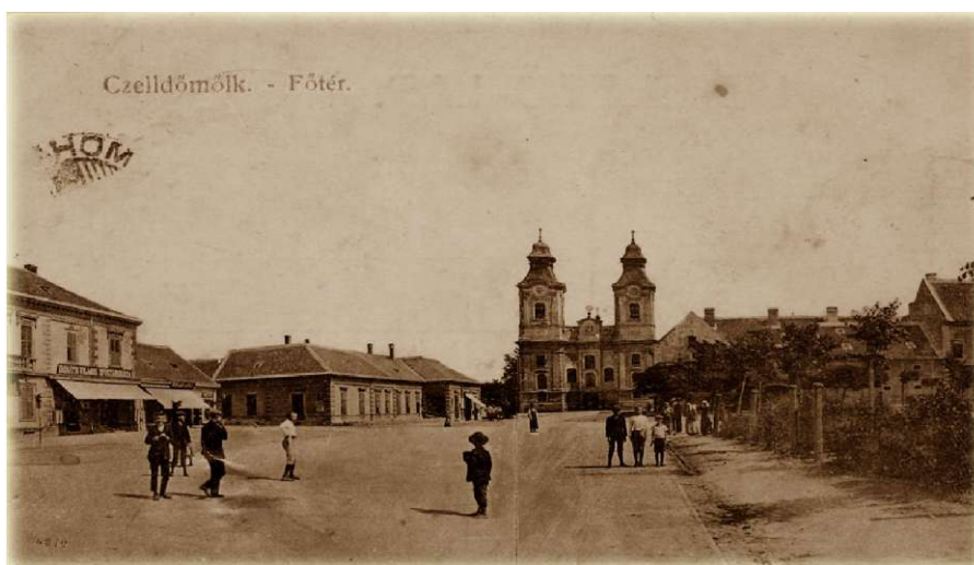
(VaML Képeslapgyűjtemény 6. sz.)